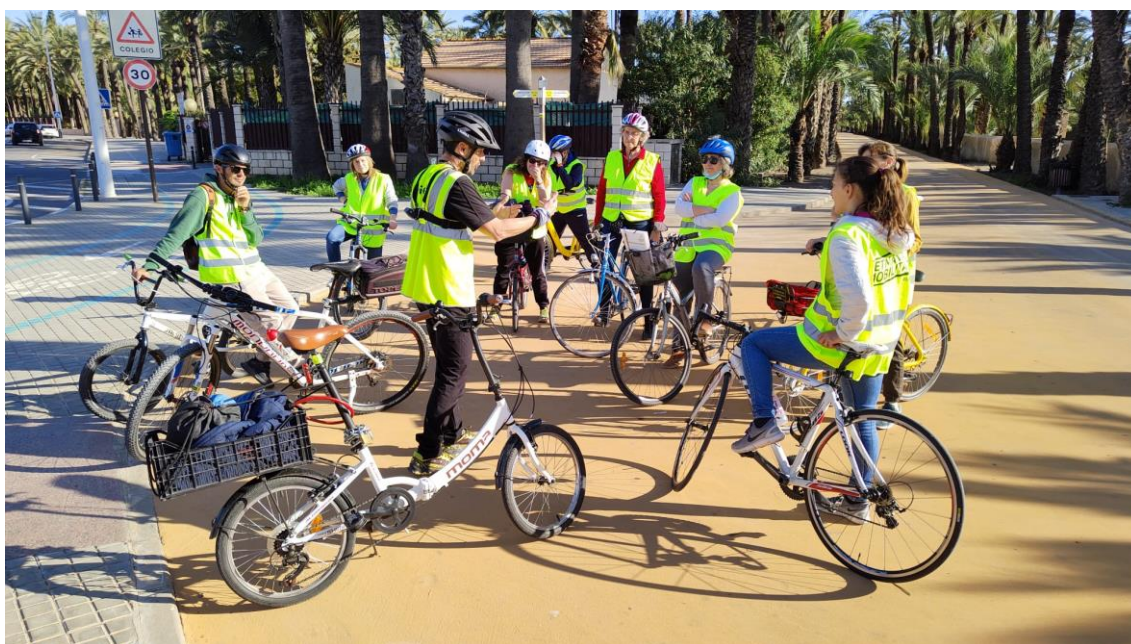
Fotografía 5. Curso “la bicicleta y la movilidad sostenible”

Cursos específicos para profesores de primaria y secundaria, con la intención de enseñarles las herramientas a nivel práctico, que les permita desarrollar las Unidades Didácticas relacionadas con el uso de la bicicleta y la movilidad sostenible, haciendo hincapié en la parte práctica de las mismas.