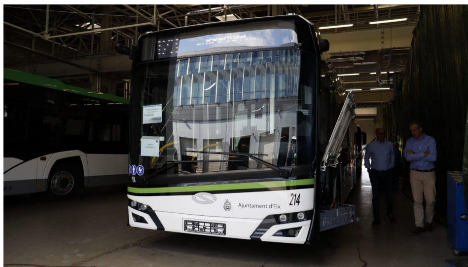
Fotografía 2. Presentación de los nuevos autobuses urbanos híbridos en Elche.