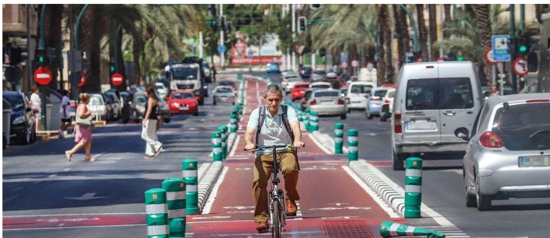
Fotografía 1. Carril bici calle Pedro Juan Perpiñan, Elche.

Y es precisamente desde ese protagonismo que adquiere el uso de transportes blandos y sostenibles como el uso de la bicicleta, hacia donde queremos enfocar nuestra presentación, mostrándoles nuestra Escuela de Educación Vial Pedro Tenza como herramienta que posibilita dicho cambio. Nuestras acciones se basan eminentemente en la acción y la parte práctica, pero no menospreciamos las campañas de sensibilización y creación de buenos hábitos saludables. Convertimos nuestra escuela por tanto, en una factoría de ciclistas, peatones y usuarios del transporte público.