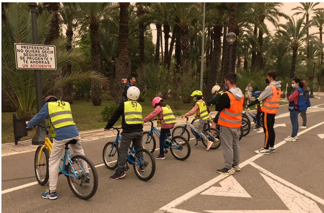
Fotografía 4. Curso de actividad extraescolar “aprende a montar en bici”.

Estudiando el impacto de la acción desde una perspectiva global, entendemos que las líneas de actuación para los próximos años, deben ir encaminadas a aumentar la oferta educativa y formativa, incluso ampliando las edades de los distintos usuarios y/o destinatarios, ofertando más cursos para adultos, cursos para ir al trabajo en bici, cursos para inmigrantes, cursos con perspectiva de género para afectadas por violencia de género, etc.