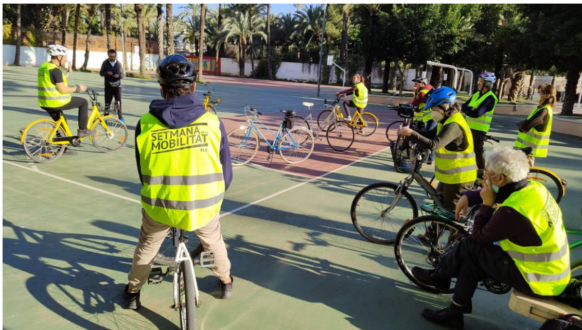
Fotografía 6. Explicación de ejercicios de progresión en el manejo de la bicicleta

Educación en valores para la Movilidad Sostenible. Elche, factoría ciclista